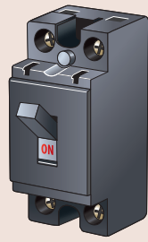
分岐ブレーカー（標準タイプ HB型） HST-20A BS1112(P)-(SE)

テスト販売の目的は市場のニーズの確認、消費者の声の収集、リスクの確認、販売予測等を行う為のもので、その実績をもって効果的な生産計画を立案し、向後において部材供給元とのタイアップを図る事にあります。